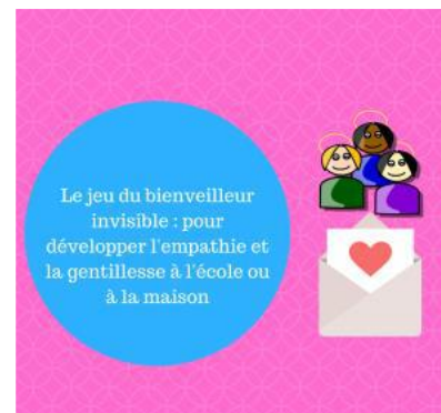
Activité Le gardien invisible