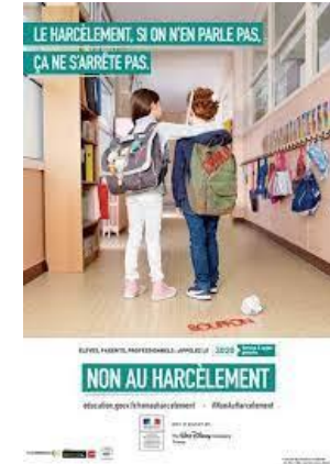
Affiche de la campagne NAH 2015