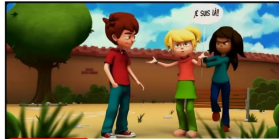
Vidéo Et si on s'parlait du harcèlement Episode 3 Non à l'exclusion !

Des activités variées sur les mots et les maux du harcèlement