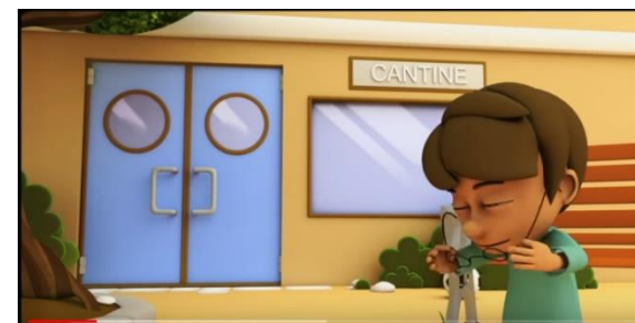
Vidéo Et si on s'parlait du harcèlement Episode 7 Des apparences trompeuses