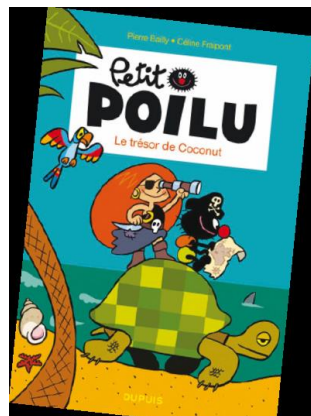
BD muette Petit Poliu, Le trésor de Coconut